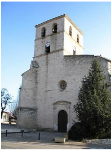
Eglise de Vazerac.